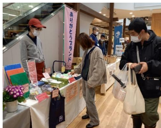
新色のトートバッグはいかかですか

また、「このタオル、とても使い心地がいいのよ。売切れる前に買っていくわ。」と、まとめて購入する人もいて、売行きは上々。合計12,985円でした。