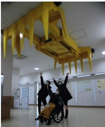
巨大なつめ ごみを 持ち上げます

見学後は、イオン上越店で、それぞれ好みの飲食店で昼食。設定額以内でメニューを選び、皆さんから大満足の声。有意義な外出訓練になりました。