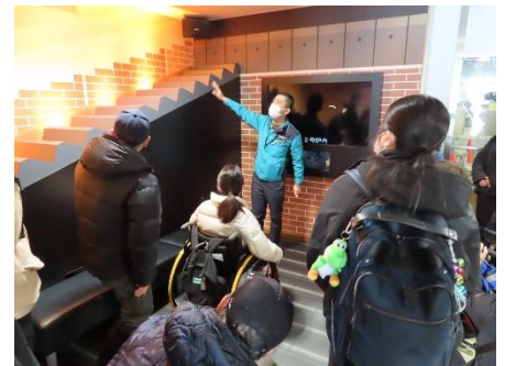
炉の中で、ゴミはこの 階段を下りながら燃えて いきます