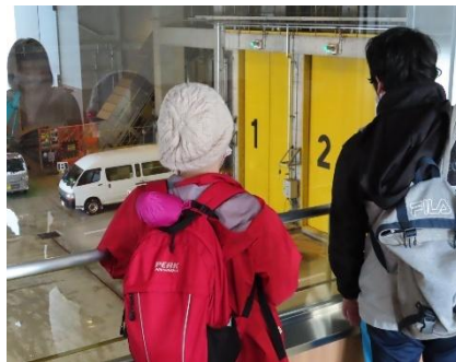
あんなに大きな扉から ごみを入れるんだね