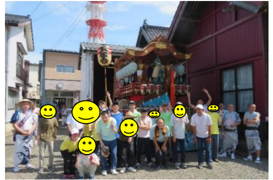
出発前に安国寺青友会と記念撮影

7月27日（土）、今年も『直江津祇園祭』の屋台引きに参加。最高気温が34.6℃と猛暑日に迫る暑さ。屋台引きが始まると気持ちが引き締まり、「わっしょい、よいやさあ」と祭囃子に合わせて威勢のよいかげ声。今年も行程を3つに分けて、交代しながら参加することで、熱中症対策。「疲れた、でも楽しかった」と、夏の思い出がまたひとつ増えました。