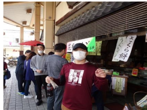
さんしよくだんご か 三色団子を買いました