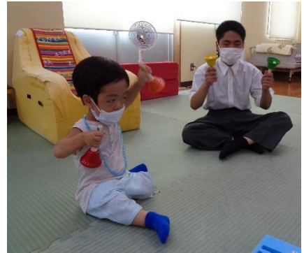
綺麗な音色が響きます

音楽を楽しみながら、仲間意識や協調性を育むハンドベル。両手にベルを持ったり、ベルを転がすようにして、音を鳴らしたり、「ド、レ、ミ、ファ、ソ、ラ、シ、ド”の音階をみんなで順番に鳴らしたりしました。最後まで、音階が鳴ると「やったー」の声。一体感が生まれました。