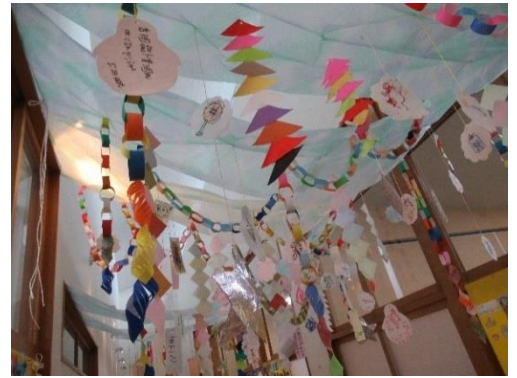
作品：七夕飾り（みんなの願い）