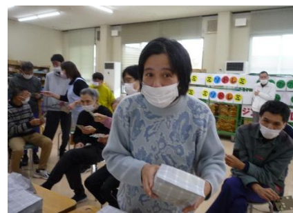
こんなにいいの、あてちゃった