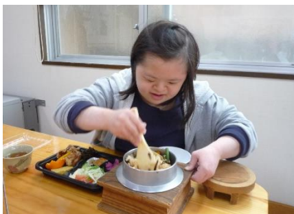
おいしそうだな。全部食べられるかな？

はや 「早くコロナがなくなってほしい」「みんなよく頑張った年だったよね」などと一年を振り返りました。