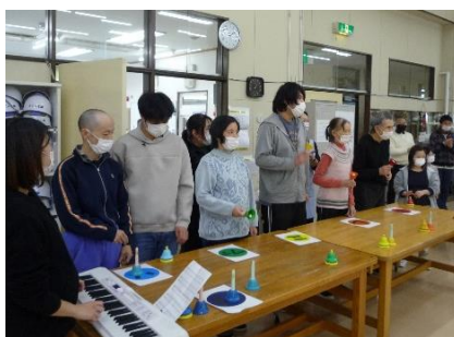
合わせるのは大変